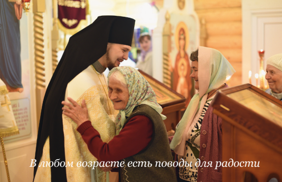
В любом возрасте есть поводы для радости