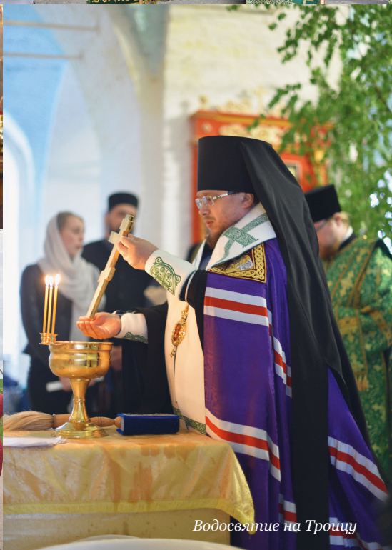
Водосвящение на Троицу