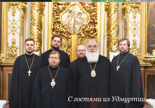
С гостями из Удмуртии