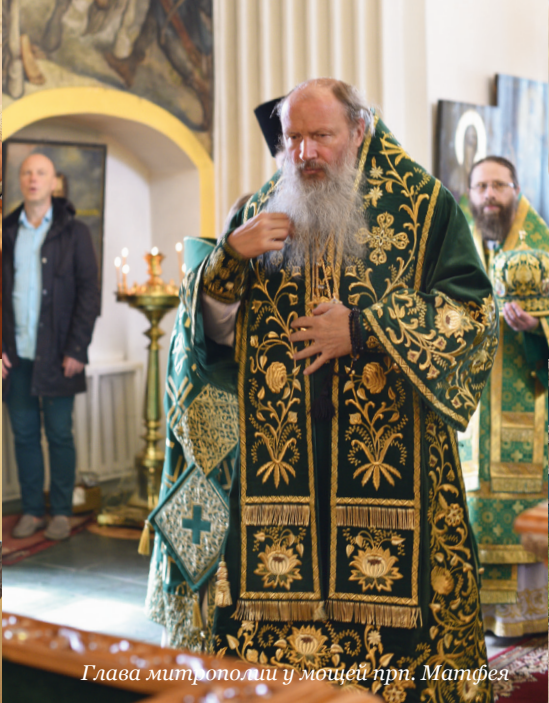
Глава митрополии у мощей прп. Матфея