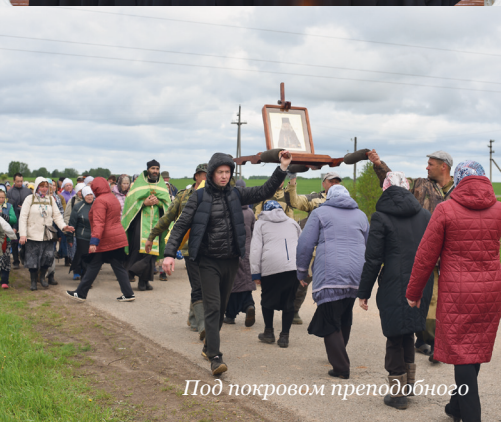
Под покровом преподобного