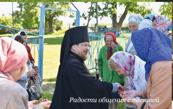
Радости общения с паствой