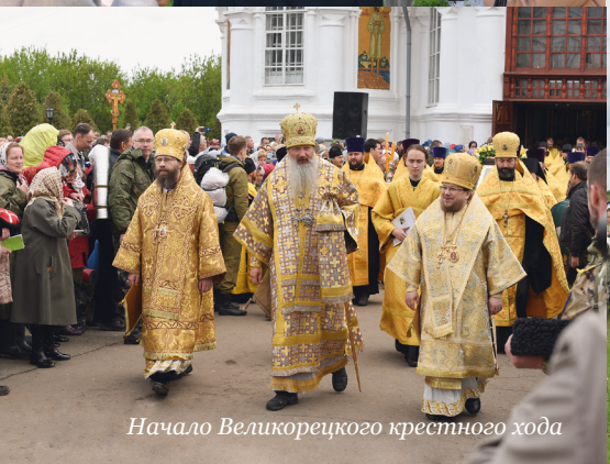
Начало Великокорецкого крестного хода