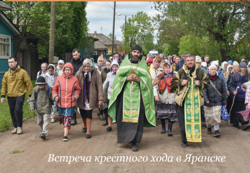
Встреча крестного хода в Яранске