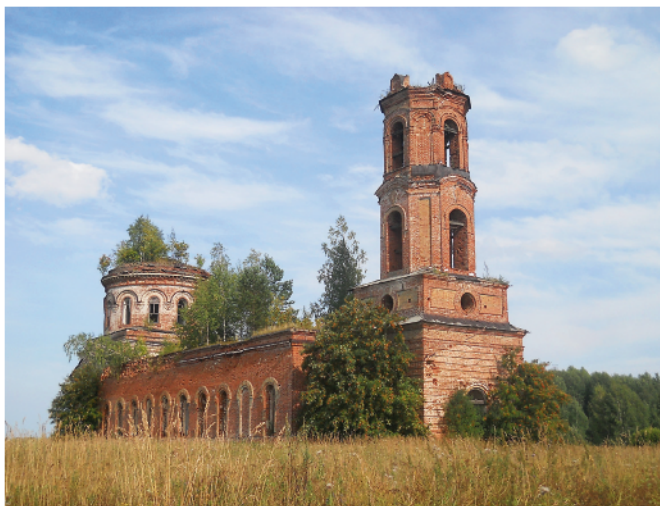
Ильинский храм в 2016 году

Хотя, как видим, в упомянутых следственных делах на нее также записаны лживые клеветнические показания. В том числе ставились под сомнения ее болезнь, неспособность к передвижению.