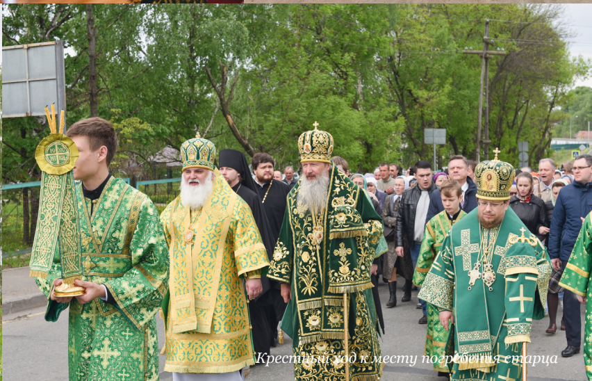
Крестный ход к месту погребения старца