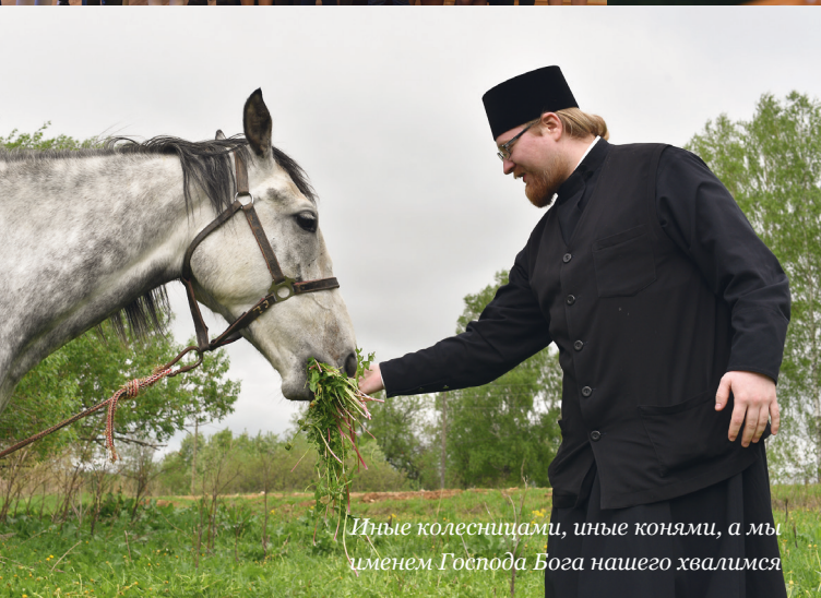
Иные колесницами, иные конями, а мы именем Господа Бога нашего хвалимся