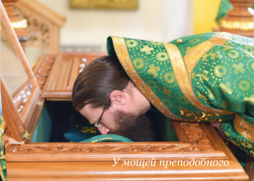
У мощей преподобного